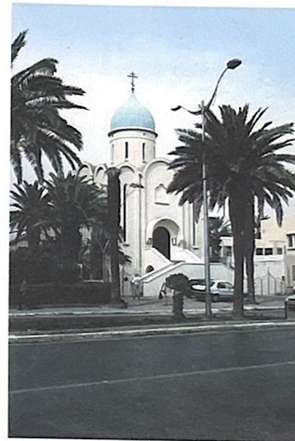
Церковь Воскресения Христова, Тунис

Пока это все известные факты о городских головах губернского Гродно, а также их ближайших родственниках. ■